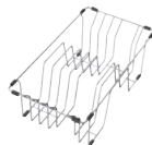
Органайзер для аксесуарів