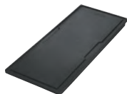
Обробна дошка пластик Sanitized®