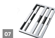
07 112.0548.292 Кришка органайзеру