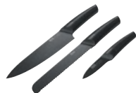
Набір з 3-х ножів нержавіюча сталь