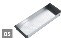
05 112.0394.981 Коландер нержавіюча сталь 429×156×54 мм