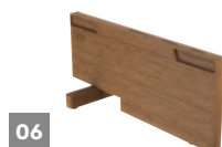
06 112.0539.135 Підставка для ножів натуральне дерево 429×180×23 мм