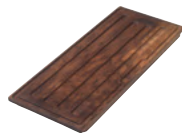
Обробна дошка з натурального дерева