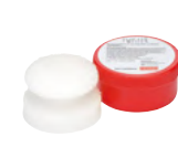
112.0007.715 Засіб для видалення плям, 125 мл