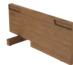
Підставка для ножів