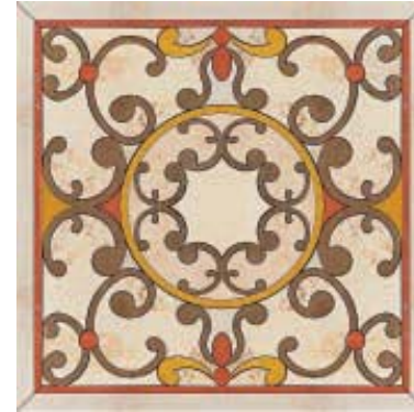
ROS.CARACALLA 90x90 - 36"x36"