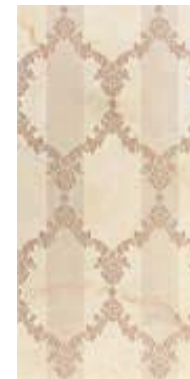
BAROQUE A1 45x90 - 18"x36" △