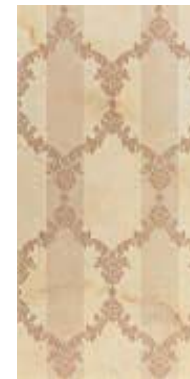
BAROQUE B1 45x90 - 18"x36" △