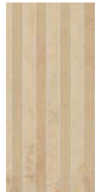
BYZANTIUM B1 45x90 - 18"x36" △