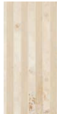
BYZANTIUM A1 45x90 - 18"x36" △