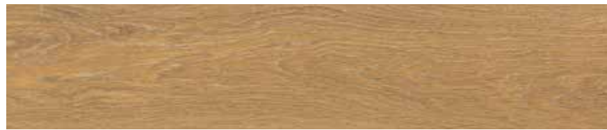
Caramel H G