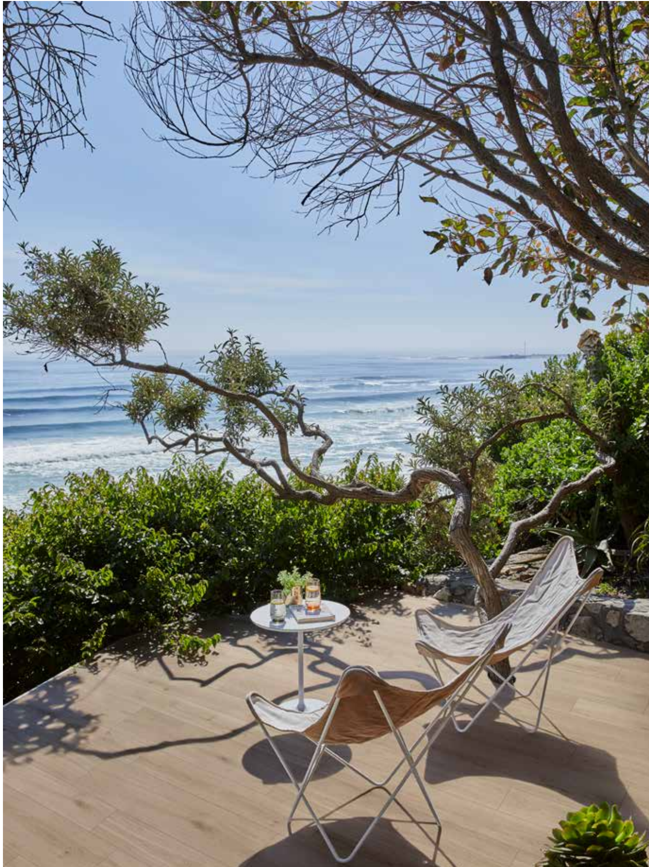
M9EG Oltre Natural Grip Rett. 20x120 M9FG Oltre Natural Grip Rett. 30x120