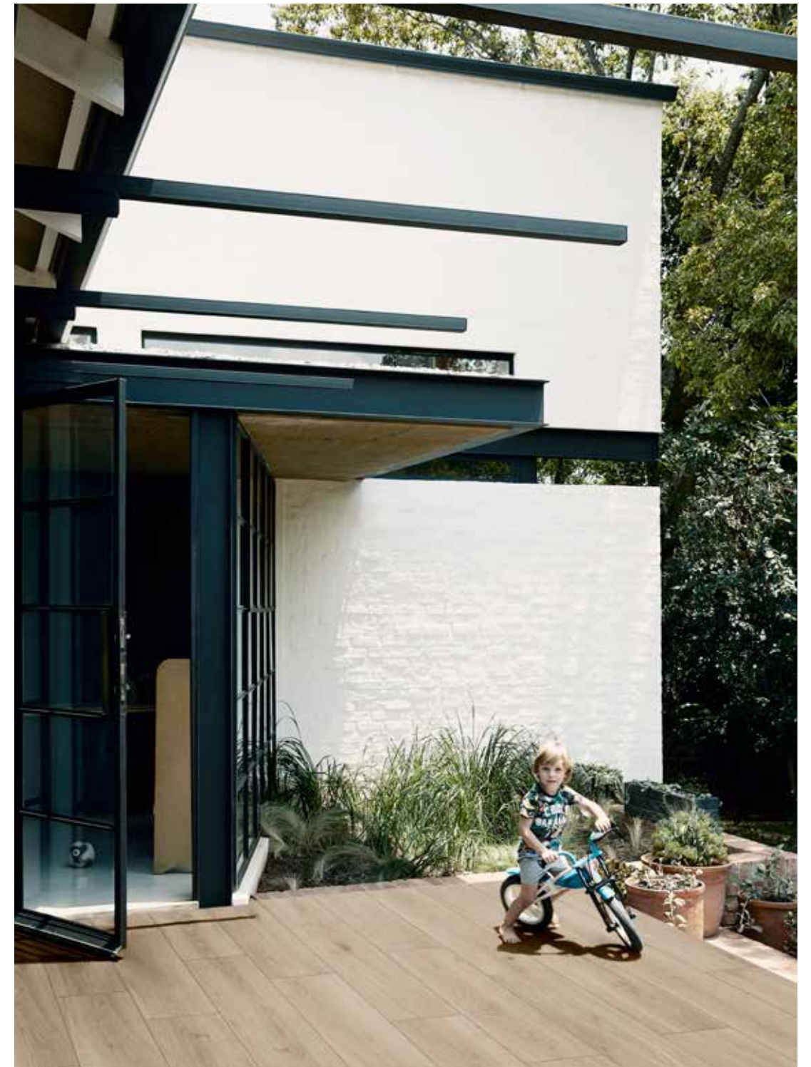
M9FG Oltre Natural Grip Rett. 30x120