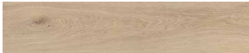
Natural H G