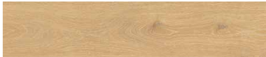
Sand H G