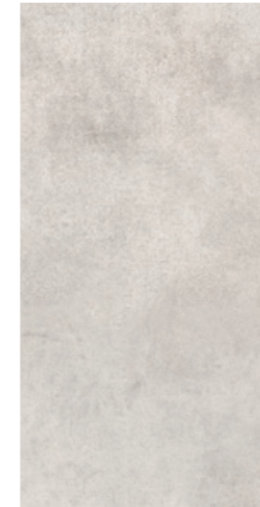
AV 10 29,7x59,7 cm natura R10 29,7x59,7 cm lappato R10