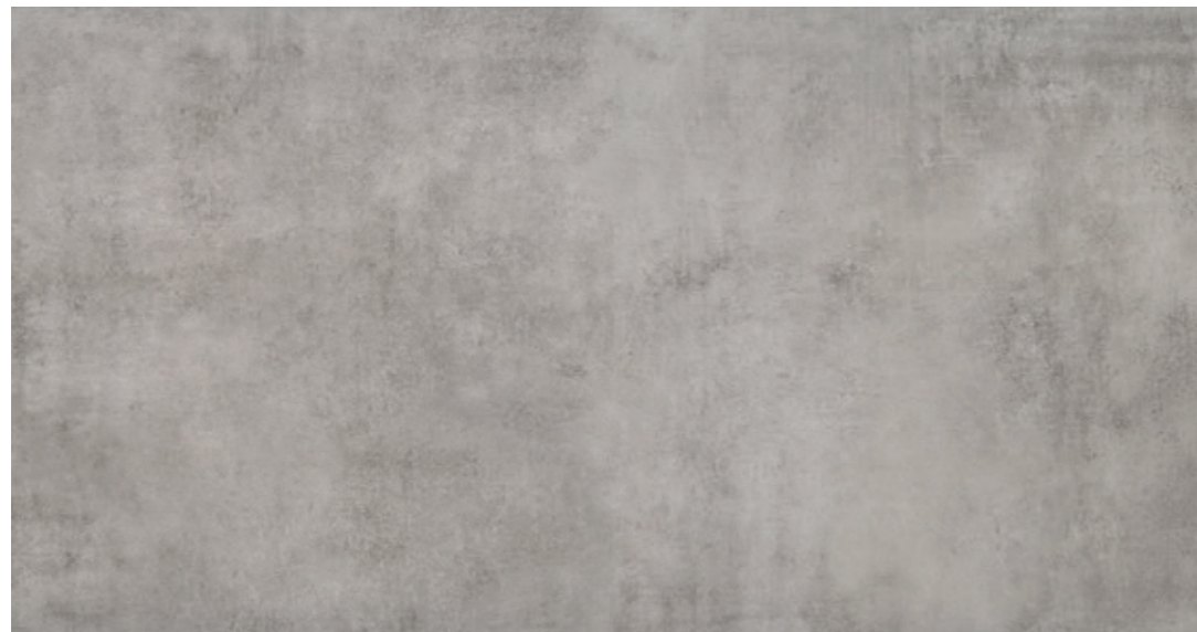
AV 12 59,7x119,7 cm natura R10 59,7x119,7 cm lappato R10