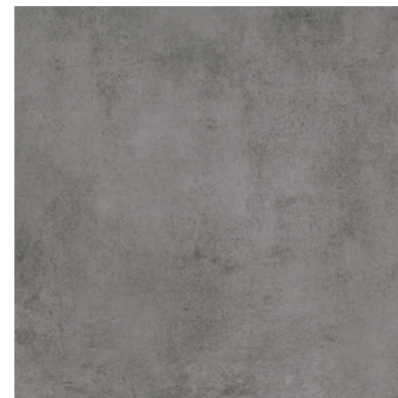
AV 13 59,7x59,7 cm natura R10 59,7x59,7 cm lappato R10