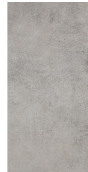
AV 12 29,7x59,7 cm natura R10 29,7x59,7 cm lappato R10