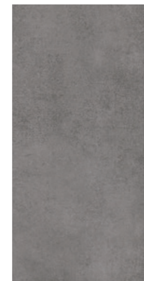
AV 13 29,7x59,7 cm natura R10 29,7x59,7 cm lappato R10