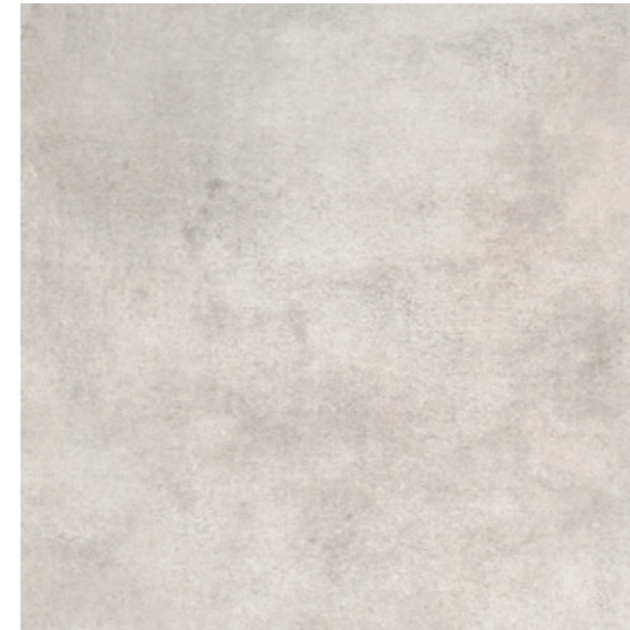
AV 10 59,7x59,7 cm natura R10 59,7x59,7 cm lappato R10