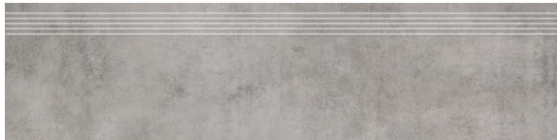
Stopnica AV 12 29,7x119,7, 29,7x59,7 cm natura R10 29,7x119,7, 29,7x59,7 cm lappato R10