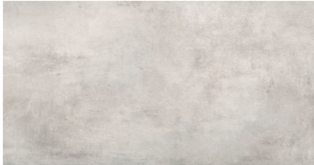
AV 10 59,7x119,7 cm natura R10 59,7x119,7 cm lappato R10