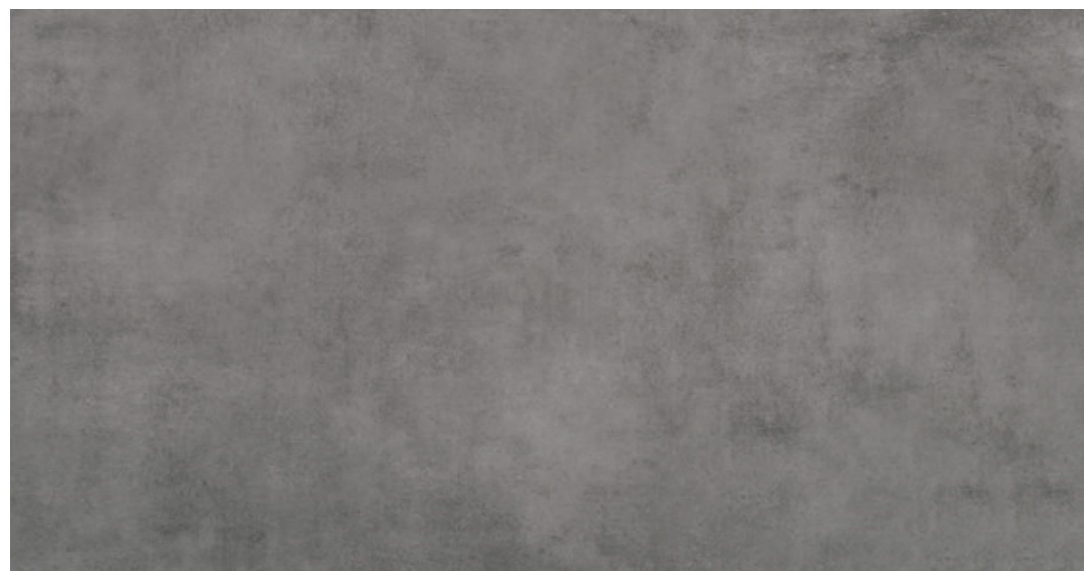
AV 13 59,7x119,7 cm natura R10 59,7x119,7 cm lappato R10