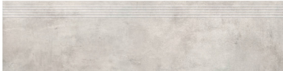
Stopnica AV 10 29,7x119,7, 29,7x59,7 cm natura R10 29,7x119,7, 29,7x59,7 cm lappato R10

Stopnica / Stair tread tiles / Treppenstufen / Ступеньки Cokół / Skirting / Sockel / Плинтусы