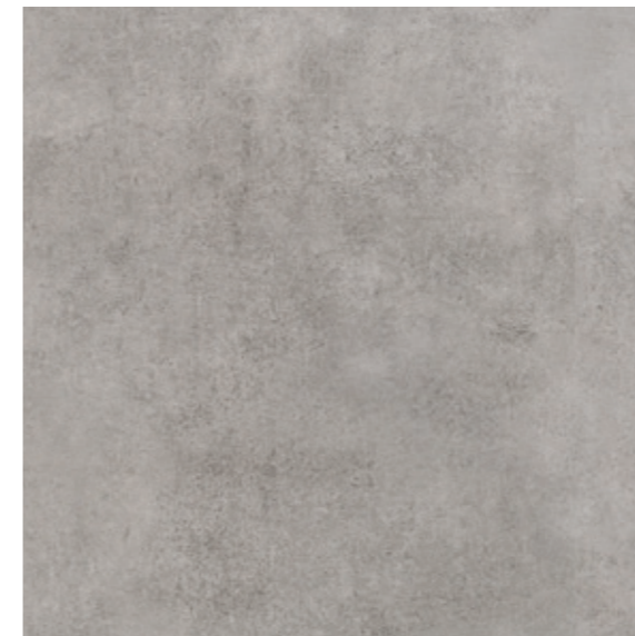
AV 12 59,7x59,7 cm natura R10 59,7x59,7 cm lappato R10