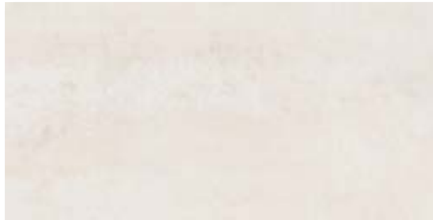
FERROKER PLATINO 45x90 cm (x10.5 mm) 17 3/4"x35 3/8" V7590171 - 100105297 - G363 Butech Recomendada junta Recommends joint colorstuk rapid n blanco B22501001 - 100004294