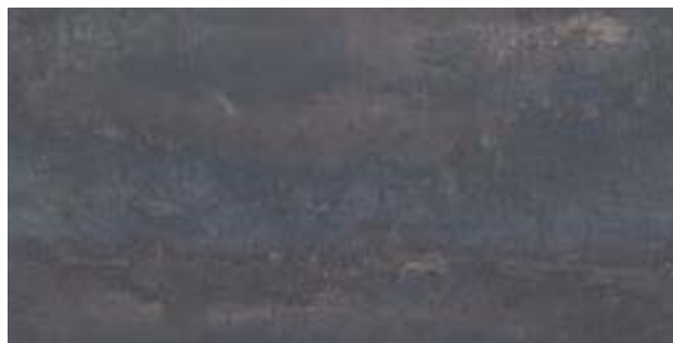
FERROKER 45x90 cm (x10.5 mm) 17 3/4"x35 3/8" V7590155 - 100103298 - G363 Butech Recomendada junta Recommends joint colorstuk rapid n antracita B22502005 - 100004298