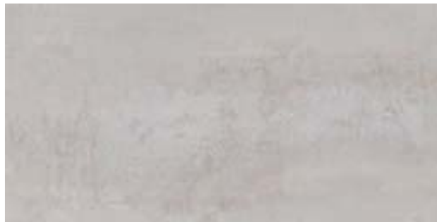
FERROKER NIQUEL 45x90 cm (x10.5 mm) 17 3/4"x35 3/8" V7590193 - 100106346 - G363 Butech Recomendada junta Recommends joint colorstuk rapid n gris B22502013 - 100004305

Utilizar materiales de colocación específicos para Gres Porcelánico Use specific Porcelain Tiles setting materials