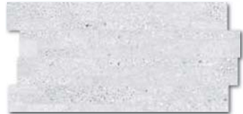
DDPSE666 (SET) PEI 5 \odot 78 / set mat/lappato | matt/lappato