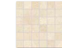
DDM0668 (SET) PEI 5 \odot 72 / set mat/lappato | matt/lappato