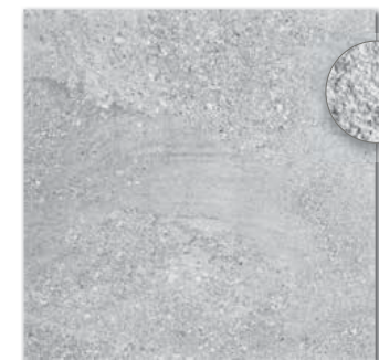
DAR63667 PEI 5 \odot 88 / m 2 mat | matt