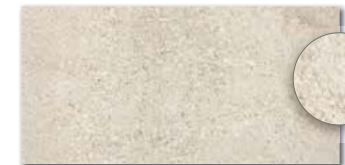
DARSE669 PEI 5 \odot 84 / m 2 mat | matt | R10 | B