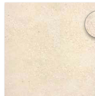
DAR63668 PEI 5 \odot 88 / m 2 mat | matt