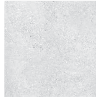
DAK63666 PEI 5 \odot 86 / m 2 mat | matt | \blacktriangle R10 | \blacktriangleright A