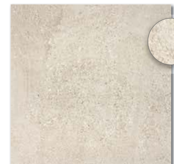
DAR63669 PEI 5 \odot 88 / m 2 mat | matt