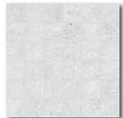
DDM0666 (SET) PEI 5 \odot 72 / set mat/lappato | matt/lappato