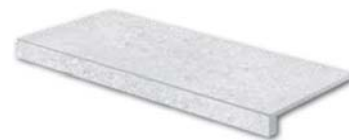
DCFSE666* PEI 5 \odot 92 / ks mat | matt | \blacktriangle R10 | \blacktriangle A

světlé šedá / light grey / jasnoszara светло-серый / világosszürke / gris claro