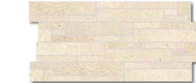
DDPSE668 (SET) PEI 5 \odot 78 / set mat/lappato | matt/lappato