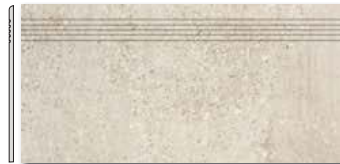
DCPSE669 PEI 5 \odot 72 / ks mat | matt