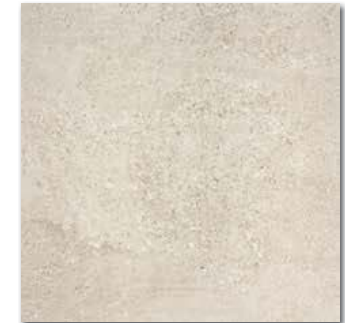
DAK63669 PEI 5 \odot 86 / m 2 mat | matt | R10 | A