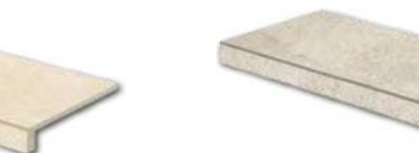
DCFSE669* PEI 5 \odot 92 / ks mat | matt | \blacktriangle R10 | \blacktriangle B

běžová / beige / bežova / бежевый / bézs / beige