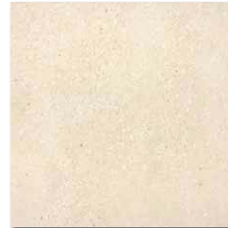
DAK63668 PEI 5 \odot 86 / m 2 mat | matt | R10 | A