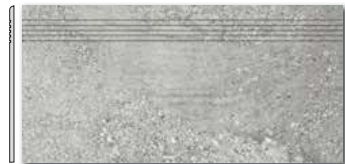
DCPSE667 PEI 5 \odot 72 / ks mat | matt