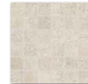
DDM0669 (SET) PEI 5 \odot 72 / set mat/lappato | matt/lappato