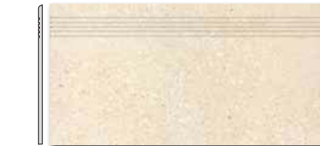
DCPSE668 PEI 5 \odot 72 / ks mat | matt