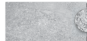
DARSE667 PEI 5 \odot 84 / m 2 mat | matt | \blacktriangle R10 | \blacktriangleright B

šedá / grey / szara / серый / szürke / gris