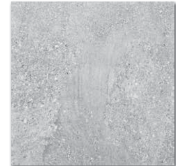
DAK63667 PEI 5 \odot 86 / m 2 mat | matt | \blacktriangle R10 | \blacktriangleright A