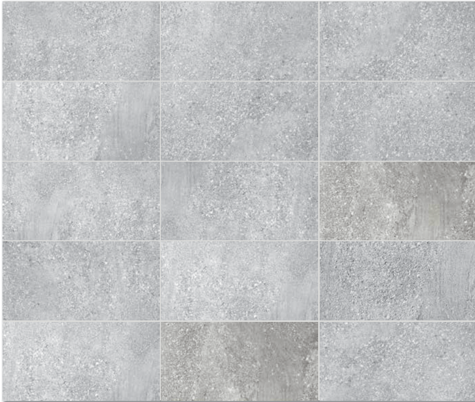
Všetchny výrobky celé série vykazují velké odchylky odstínové difference V3. / All products of the entire batch show big deviations in shade difference V3.

Před pokládkou doporučujeme jednotlivé obkládové prvky vybrat z několika kartonů a výslednou plochu komponovat podle inspirativní fotodokumentace z katalogů RAKO případně z webových stránek www.rako.cz