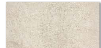
DAKSE669 PEI 5 \odot 80 / m 2 mat | matt | R10 | A