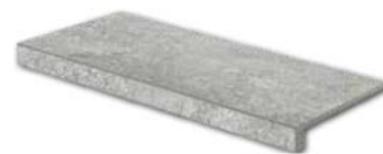
DCFSE667* PEI 5 \odot 92 / ks mat | matt | \blacktriangle R10 | \blacktriangle A

světlé šedá / light grey / jasnoszara светло-серый / világosszürke / gris claro