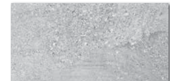
DAKSE667 PEI 5 \odot 80 / m 2 mat | matt | \blacktriangle R10 | \blacktriangleright A