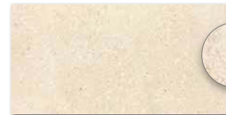
DARSE668 PEI 5 \odot 84 / m 2 mat | matt | R10 | B