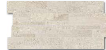
DDPSE669 (SET) PEI 5 \odot 78 / set mat/lappato | matt/lappato