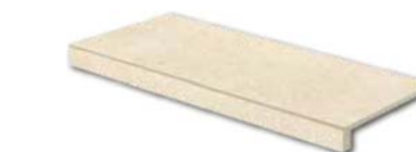
DCFSE668* PEI 5 \odot 92 / ks mat | matt | \blacktriangle R10 | \blacktriangle A

šedá / grey / szara / серый / szürke / gris