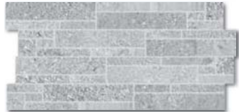
DDPSE667 (SET) PEI 5 \odot 78 / set mat/lappato | matt/lappato