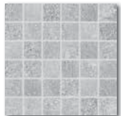
DDM0667 (SET) PEI 5 \odot 72 / set mat/lappato | matt/lappato