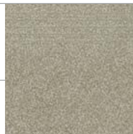
ZVX18B STEP / СТУПЕНЬ