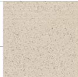
ZVX11B STEP / СТУПЕНЬ