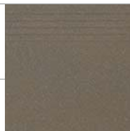
ZVX19B STEP / СТУПЕНЬ