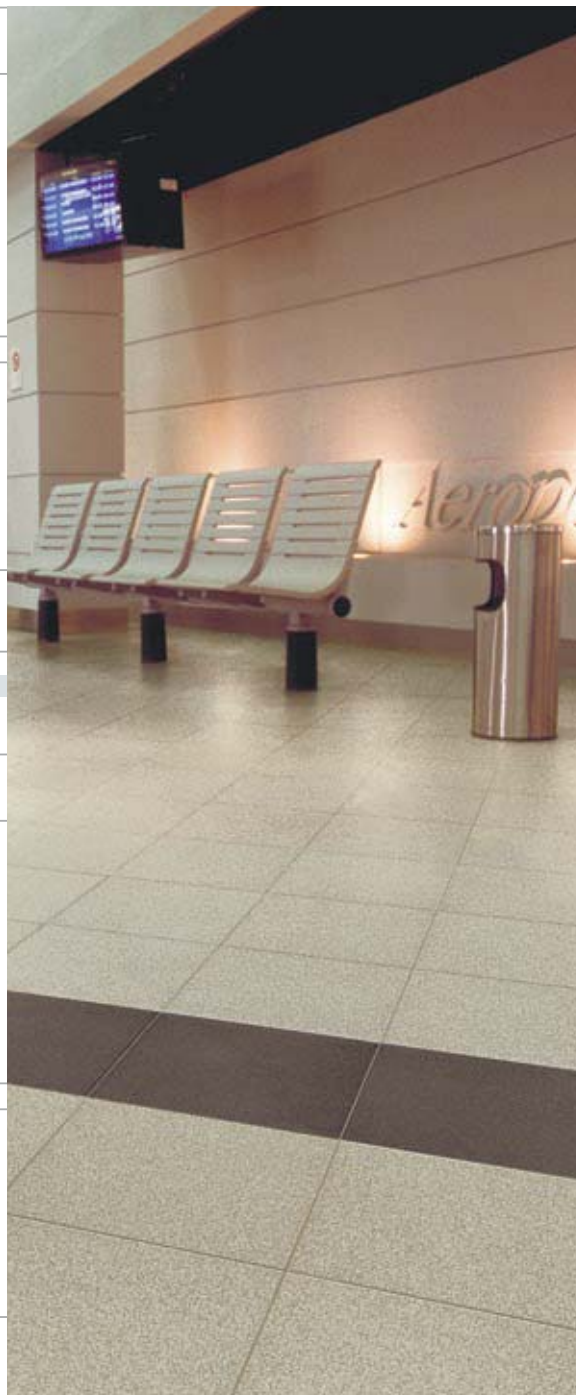
CARDOSO - BASALTO 30x30